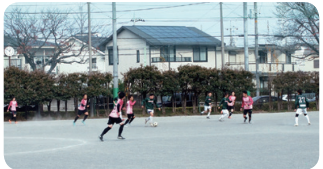
市民大会・一般 決勝

2022年度、新型コロナウイルス感染症の影響もまだまだある中で各カテゴリーとも感染対策を徹底し、観客数も調整しながら徐々に通常に近い大会の開催が可能となり市民大会(一般、少年)市内低学年大会、市民リーグ(一般部)少年部、ジュニアユースの公式戦、等も開催が来ています。