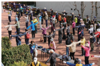
開会式後準備体操

令和 5 年 3 月 5 日(日) 第42回歩こう会を、平成30年度の多摩湖周回コースを実施して以来 4 年ぶりに開催いたしました。薄曇りのお天気でしたが雨の心配もなく 238名と多くの参加者が集まる中、尾崎保夫市長はじめ市議会佐竹康彦副議長、真如昌美教育長のご出席をいただき開会式を行いました。予定の 9 時 30 分に出発し、今回は多摩湖中堰堤の道路拡幅改修工事で、多摩湖周回コースが設定できないため新しいコースを用意し、中央公民館前をスタートし、市内中央通り~上仲原公園~多摩湖南側周回~郷土博物館前~中央公民館をゴールとする約 8.2km コースに健脚を披露してもらいました。11時20分頃にはトップの方がゴール、その後次々とゴールし、11時50分頃には全員ゴールされました。