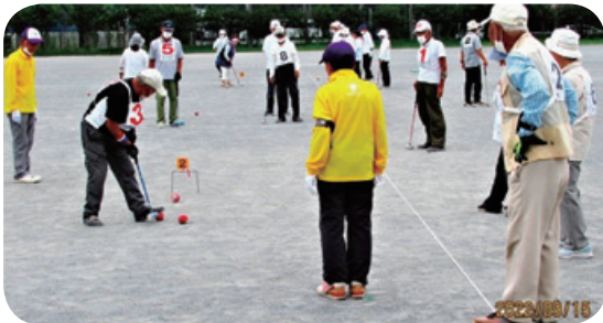
市民体育大会ゲートボール競技の様子