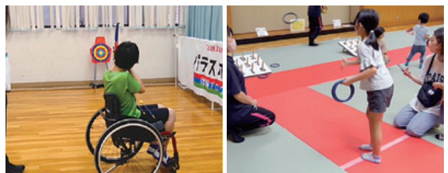
地階で開催のパラスポーツ 体験プログラム、アーチェリー