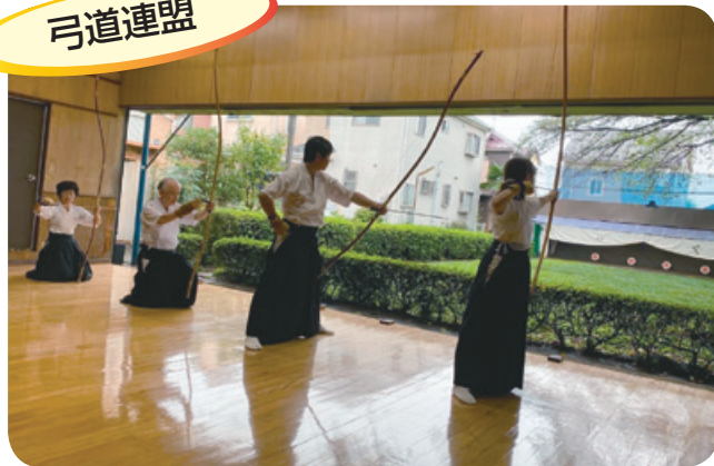
市民大会における色的(点数制)行射

未だ終息の見えないコロナ禍の中ではありますが、東京都連内対抗戦や昇段審査等も入退館時間の指定や射数制限等により何とか実施されるようになりました。当連盟においては引き続き他市との親善試合及び独自講習会等を中止し、連盟会員による月例射会も午前・午後の2部制で半数人ずつ短時間で実施していますが、3年ぶりの初心者教室の開催や合宿研修を復活させ、市民大会も射数を減らして何とか実施に至ることができました。