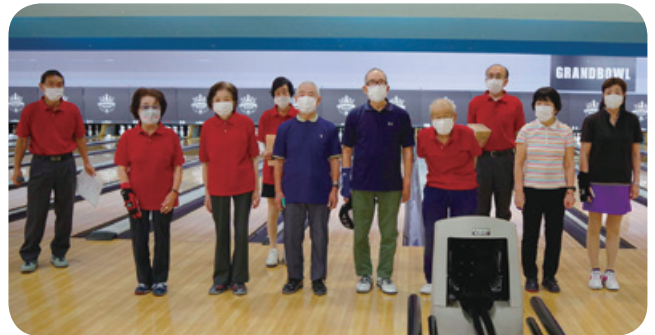
前列が長寿ボウラー

日本ボウリング場協会では、ボウリングを定期的に(月1回以上)に楽しんでいる高齢者を対象に「長寿ボウラー番付」を発表しております。