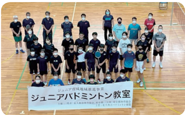
ジュニア育成地域推進事業 ジュニアバドミントン教室