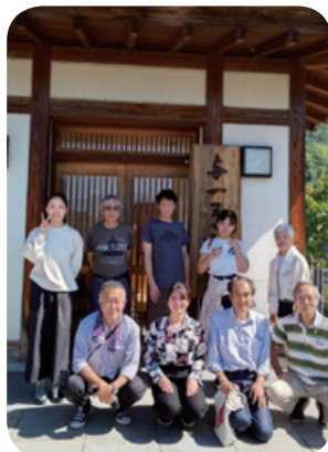
山梨での合宿研修

未だ終息の見えないコロナ禍の中ではありますが、東京都連内対抗戦や昇段審査等も入退館時間の指定や射数制限等により何とか実施されるようになりました。当連盟においては引き続き他市との親善試合及び独自講習会等を中止し、連盟会員による月例射会も午前・午後の2部制で半数人ずつ短時間で実施していますが、3年ぶりの初心者教室の開催や合宿研修を復活させ、市民大会も射数を減らして何とか実施に至ることができました。