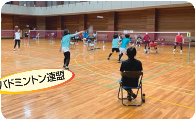
バドミントン連盟