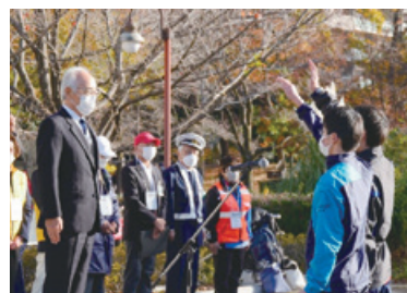
第四中学校の生徒による選手宣誓

今年度も、大きなトラブルもなく円滑な運営ができました。ご協力をいただいた警視庁東大和警察署、北多摩西部消防署、医療従事者、東大和地区交通安全協会の各関係者に厚くお礼を申し上げます。