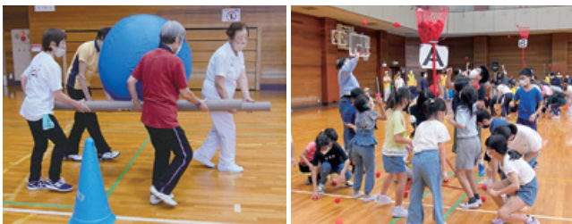
午前の部 大玉はこび