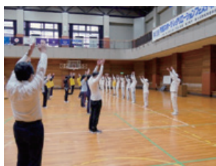
開会式後のラジオ体操

今回も、目的であるスポーツへの参加意欲と世代間の交流が図られたと思いますが、今後は健康者だけではなく、障害者も参加できるアトラクションが必要と感じました。