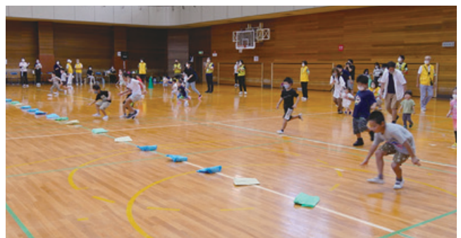
「お土産は何か」スタート

地階では、A室側でスポーツ推進委員の協力により、輪投げと、ニュースポーツのラダーゲッター、ポットス、風船バレーボールの体験に訪れた多くの参加者が挑戦されました。B室側で東京都TEAM BEYONDの協力により、パラスポーツ体験プログラムが紹介され、ゴールボール、アーチェリー、VRを利用したバドミントンの各体験が行われました。特に午後からは多くの皆さんが訪れました。(こちらの参加者は第2体育室Aで175人、第3体育室Bで196人、いずれも延べ人数でした)