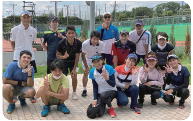
2022年東京都市町村対抗庭球大会(太田杯)出場選手

テニス連盟は、テニスを通じての交流、技術の向上を目的に、5団体で活動しています。今年は、新型コロナウイルスのために休止していた大会(男女シングルス、男女ダブルス、団体戦、ミックスダブルス、計12大会)を開催するとともに、上位団体東京都市町村