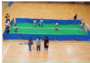
アイスホッケーの体験競技