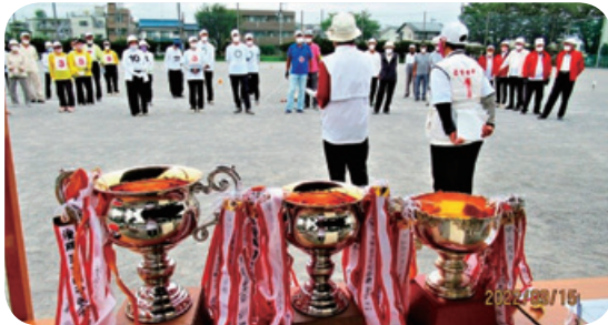
市民体育大会ゲートボール競技開会式

また、奈良橋市民センター裏庭にて毎週木曜日、初心者のゲートボール教室を開催していつでも、当協会の入会をお待ちしております。