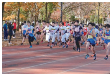
5,000m中学生(1年、2・3年)の部スタート

当日は風も無い絶好のレース日和で、8時15分からの開会式で尾崎市長から開会のご挨拶をいただいた後、第四中学校の選手による選手宣誓で開会の火ぶたが切られました。