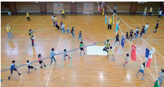
午前の部 十文字綱引き

令和4年9月25日(日)、前日まで台風の余波で雨天続きの空も、今日は朝から薄日が差して気象が回復傾向にある中、市民体育館を主会場にした第52回ふれあい市民運動会がコロナ感染対策を講じながら開催することができました。