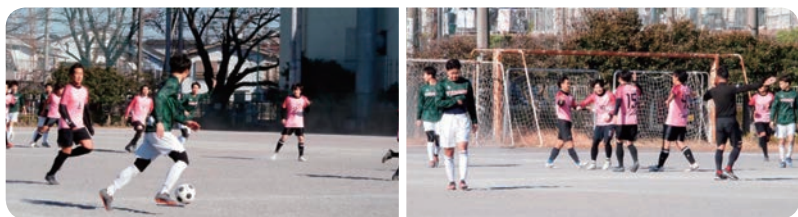
市民大会・一般の部 決勝

4年ぶりに再開した事業が2つあります。第一は「懇親旅行」。6月に黄門様ゆかりの庭園アジサイ祭り見学と大洗海岸での昼食などで43名の参加がありました。第二は「夏休みこどもラジオ体操大会」。しかし子供の参加人数は19年度の半数の平均29名でした。4年のブラン