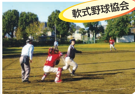
市民体育大会 軟式野球大会 (11月19日)