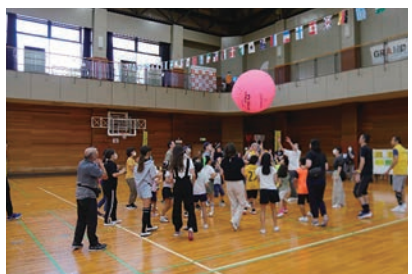
キンボールリフティッグ