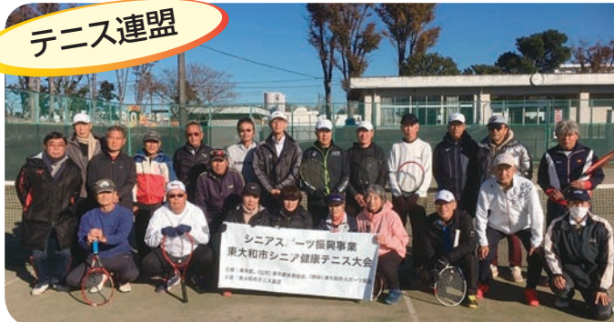
シニア健康テニス大会

テニス連盟は、テニスを通じての交流、技術の向上を目的に、5 団体で活動しています。今年は 70 歳以上の方対象の男子ダブルス C の初開催と久々のシニア健康テニス大会を含めて男女のシングルス、ダブルスとミックスダブルスと団体戦の計 14 大会を開催し、