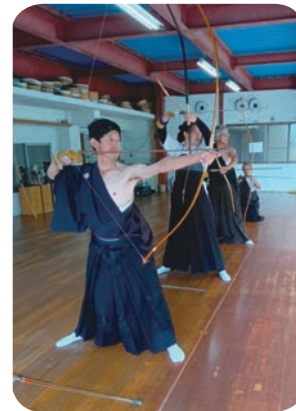
山梨での合宿研修

都連内の大会や昇段審査等の行事も入退館時間の指定や射数制限等はあるものの、例年どおり行われるようになりました。当連盟においても多人数となる他市との交流試合は自粛しましたが、合宿研修の実施や、連盟会員による月例射会は年度途中より2部制から合同開催に戻し、市民大会には市長・教育長・スポーツ協会長をお招きし、従前どおりの種目を行うことができました。