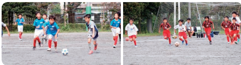
市民大会・少年の部 4年生大会の様子

また、3月の卒業大会となる少年部の東大招待少年サッカー大会も去年度につづき完全開催に向け準備を進めています。