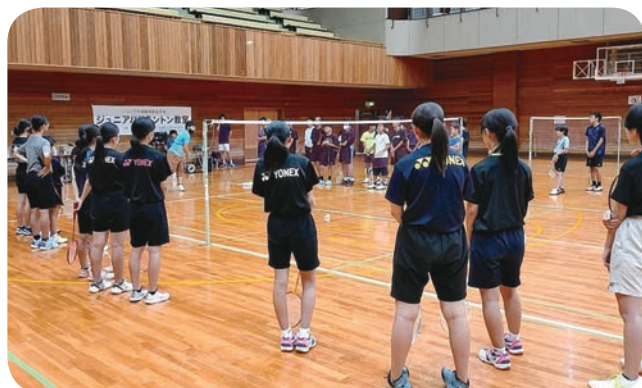
ジュニアバドミントン教室

バドミントン連盟では 6 月に 3 ダブルス対抗による団体戦、9 月に市民大会ダブルス大会、10 月に同シングルス・トリプル大会を実施し、1 月には交流試合も取り入れた男女混合ダブルス大会を実施しました。また、ジュニア世代への普及と競技力向上を目的に、中学生向けにジュニアバドミントン教室も開催しました。都民大会では男子団体戦で 3 回戦まで勝ち上がりベスト 16 の成績でした。