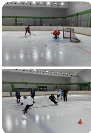
東京都主催 ジュニア育成地域推進事業 ジュニア強化練習の様子