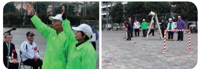
40周年記念ゲートボール大会 選手宣誓 40周年記念ゲートボール大会 始球式

として、Rondôzaki Hill Fieldで行われ、当協会員35人の従事者と29人の来場者にてゲートボールの面白さ難しさを味わっていただき