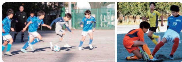
市民大会・少年の部 5年生大会の様子