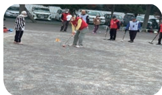
スポーツレクリエーションフェスティバル競技体験

また、11月23日には、(特非)東大和市スポーツ協会主催のスポーツレクリエーションフェスティバルのゲートボール体験会をフィールドでは初めての試み