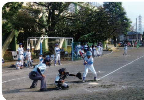
市民体育大会 少年大会 (10月9日)