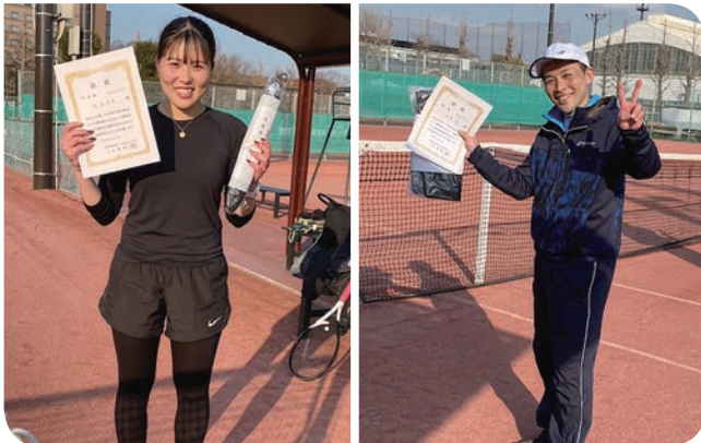
東京都市町村テニス協会の男女シングルス

テニス連盟は、テニスを通じての交流、技術の向上を目的に、5 団体で活動しています。今年は 70 歳以上の方対象の男子ダブルス C の初開催と久々のシニア健康テニス大会を含めて男女のシングルス、ダブルスとミックスダブルスと団体戦の計 14 大会を開催し、