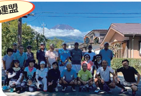
山中湖テニス合宿