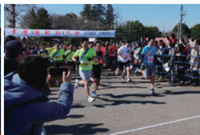
一般男子2.5km×4のスタート