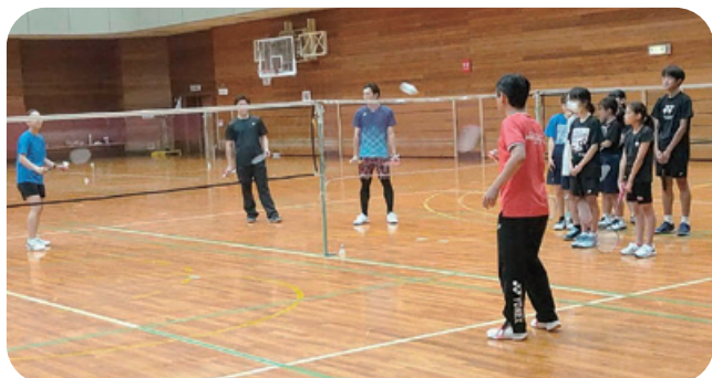
ジュニアバドミントン教室で著名指導者の指導を受ける参加者

今年度、バドミントン連盟では3ダブルス対抗による団体戦、市民大会ダブルス大会、男女混合ダブルス大会を実施しました。市民大会シングルス・トリプル大会は衆議院選挙開票会場となり中止としました。高齢者の健康増進を目的にシニアバドミントン交流会、ジュニア世代の普及と技術向上を目的にジュニアバドミントン教室等も実施しました。当連盟では、一緒にバドミントン活動を盛り上げていただける個人・団体を募集してます。