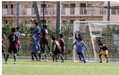
市民大会・一般の部 決勝及び3位決定戦

シニア女子O-35への市代表チームが参加し各カテゴリー代表チームの活躍が期待されます。また、3月の卒業大会となる少年部の東大和招待少年サッカー大会も開催に向け準備を進めており、大会を通じていろいろな地域のチームと交流が楽しみです。