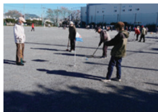
ゲートボール競技の様様

今年も「スポーツウエルネス吹矢」を東大和けやき支部の方々がスタッフとして体験会とミニ大会を開催し、ポッチャ体験は、スポーツ推進委員の方々のご協力により、初心者の方も試合が出来るようになり、吹