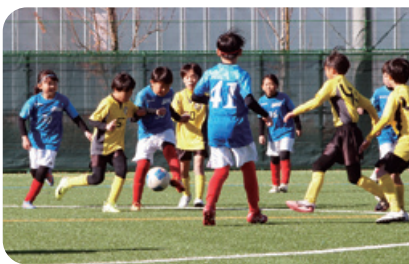
市民大会・少年の部 4年生大会の様子

2024年は、パリオリンピック、パラリンピックが開催され、日本のアスリートの活躍が映像をとおして熱く伝わりました。サッカーでは、2026W杯アジア最終予選の男子代表の快進撃で、市内の低学年大会(春季・秋季)、市民リーグ(一般部)少年部、ジュニアユースの公式戦、女子リーグなど盛りあがりを見せています。特に、9月にオープンした清原中央公園運動場は、市内初の人工芝グラウンドで、市民大会一般の部、少年の部、の決勝戦等を開催出来ました。この人工芝グラウンドは、ただ、きれいなグラウンドが出来たと言う事だけではなく、ジュニア、ジュニアユースの育成年代の技術向上へより良い影響が出るはずです。年明けの2月～3月には、多摩地区最大の三多摩サッカー大会が開催され今年度も男子一般、シニア男子O-40、シニア男子O-50、