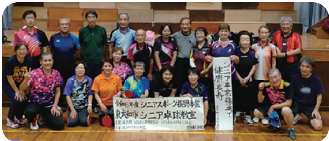
シニア事業 シニア卓球教室

卓球連盟は、昨年度皆様のお陰で盛大に創立50周年を迎える事が出来ました。これも偏に毎週開催している第八小学校体育館での日曜開放卓球練習会を維持して頂いた先代の会長、理事の皆様のお陰と感謝しております。お陰様にて練習会を利用する卓球愛好家の皆様も増加し無事故で活気に満ちております。