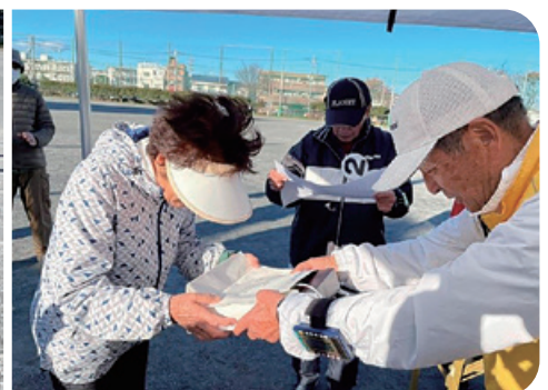
第3位入賞の賞品授与