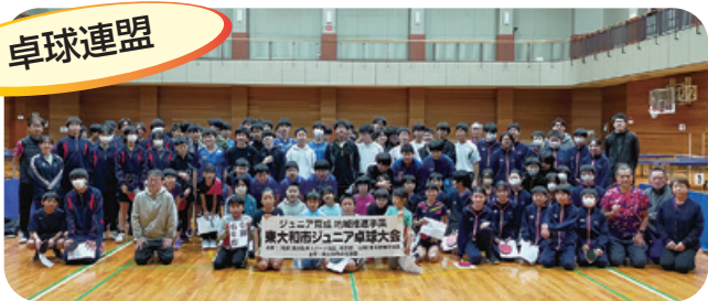
ジュニア育成事業 ジュニア卓球大会