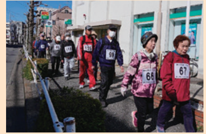
りそな銀行前を歩く参加者