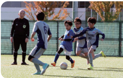
市民大会・少年の部 6年生大会の様子