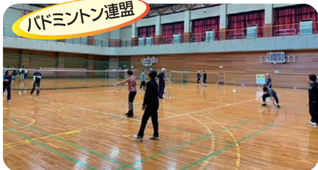
シニアバドミントン交流会で交流戦(手前2面)とネオテニス体験(奥のコート)