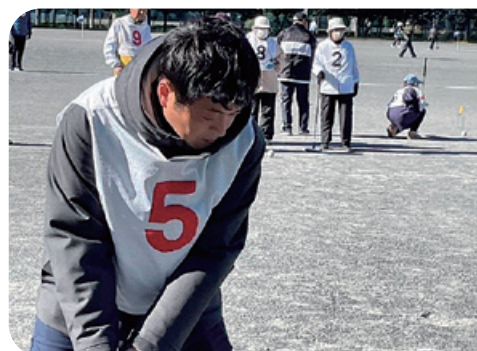
ゲートボール初めての未経験者

その未経験者の感想が次のとおりです。 「両親の誘いで親孝行のためにという軽い気持ちでしたが、それが全くもって想定外のことになりました。まずはゲートボールが面白い！ というのも私はジュニアの頃からの長いテニス経験があり、たま感には自信がありましたので、その長所をいかして、ご老人の皆様にも太刀打ちできるとの思いが、そうでな