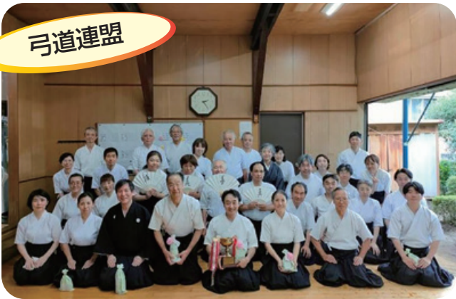
証し矢射会参加者

催することができました。招待人数を若干制限した中ではありましたが、久しぶりの交流を大いに楽しむこ