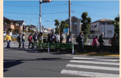
青梅街道市役所東交差点を歩く参加者