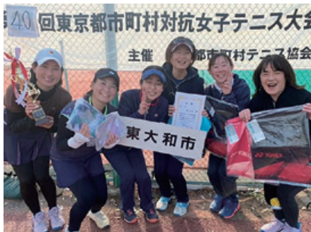
さくらトーナメント3位女子チーム