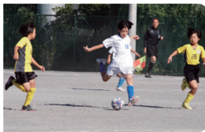
市民大会・少年の部 5年生大会の様子