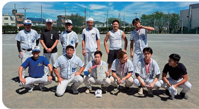
市民スポーツ体育大会優勝：アウト