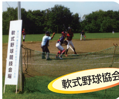
バッターボックス

現在、少年野球は7チーム、大人35チームあります。愛好者の方のご加入をお待ちしています。