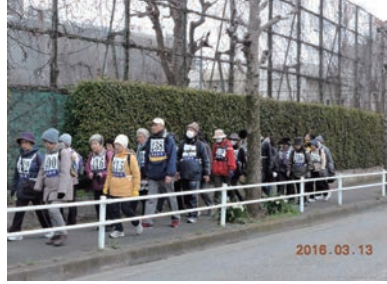
スタート直後の参加者の皆さん (昨年の実施風景)