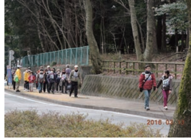
八幡神社北の登りで参加者の皆さん (昨年の実施風景)